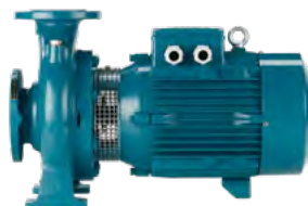
GG20 Støbejern PN10 Max. 90/120° 25-65 mm 0.25-5,5 kW