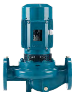
GG20 Støbejern PN10 Max. 90/120° 32-65 mm 0.37-4,0 kW