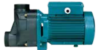
SPA Plast, normalt-ansugende, ikke selvansugende