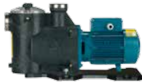
MPC Plast, selvansugende, indbygget forfilter