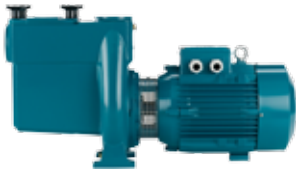
B-NMP Bronze, selvansugende, indbygget forfilter

Selvansugende pumper anvendes fx på hoteller, campingpladser og i poolhuse. Alle pumper leveres i bronze eller plast